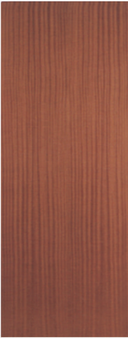
• • • P