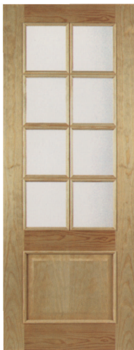
• • • R1V8