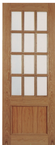
• • • L1V12