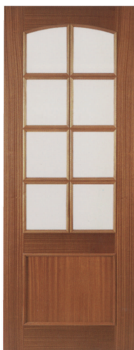
• • • L1EV8