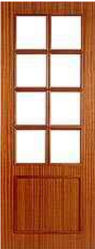
• • • PH1V8