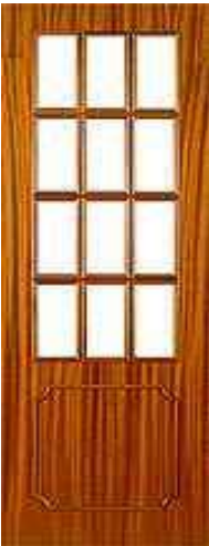
• • • PA1V12