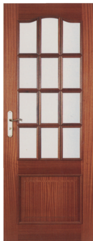
• • • R1PV12