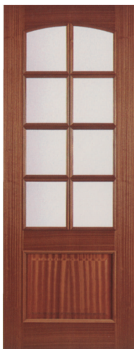
• • • R1EV8