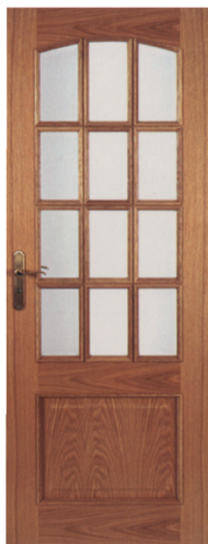
• • • R1EV12