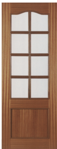
• • • L1PV8