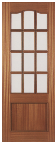
• • • L1PV12