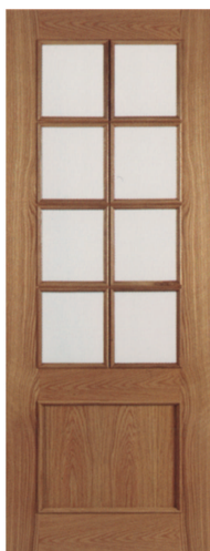
• • • L1V8