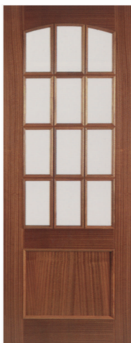
• • • L1EV12