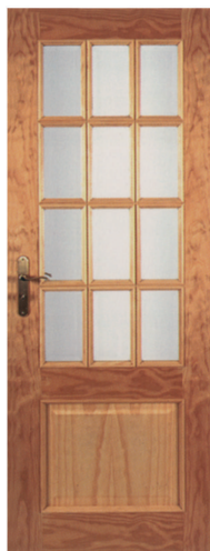
• • • R1V12